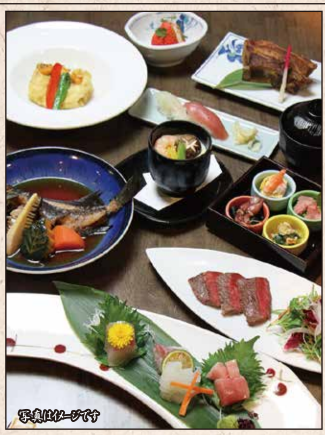
写真イメージです